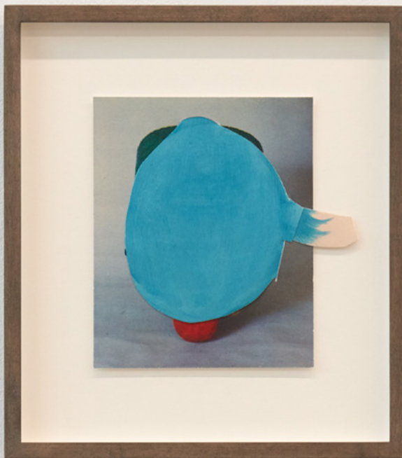
Untitled (figure 45), 2019 Collage with photo and gouache painted paper, wood frame with museumglass, courtesy of The Ravestijn Gallery

Hoe blijf je geïnspireerd? 'Als ik door de kringloopwinkel neus, ontstaat er altijd wel iets. Al haal ik mijn inspiratie ook uit heel andere dingen. Zo vind ik stoffen poppen ontzettend interessant, omdat ik ze als een soort constructie zie. Het is uiteindelijk maar een simpele lap stof, maar je kunt er als kind onwijs veel betekenis aan hangen.'