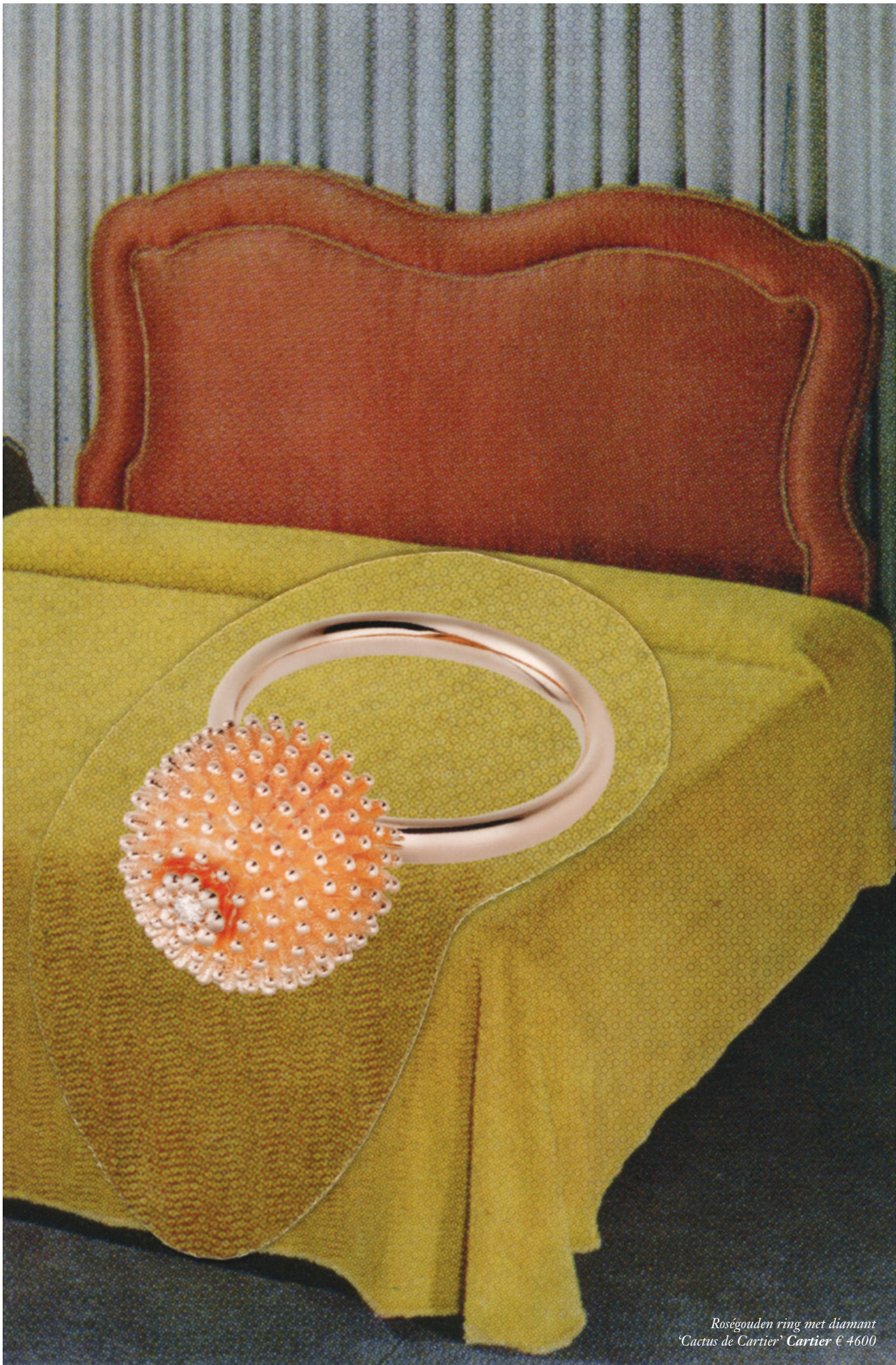
Roségouden ring met diamant 'Cactus de Cartier' Cartier € 4600