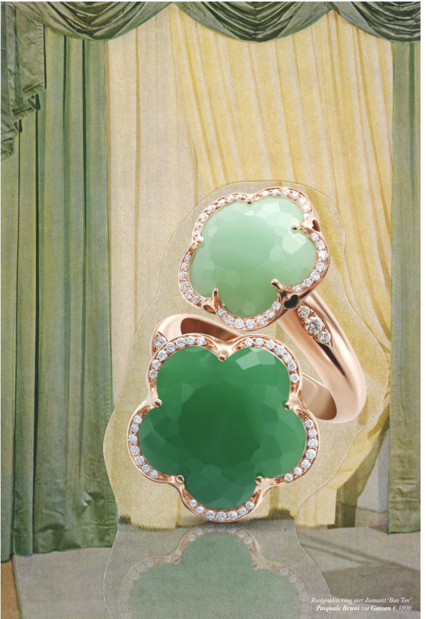
Roségouden ring met diamant 'Bon Ton' Pasquale Bruni via Gassan € 3900