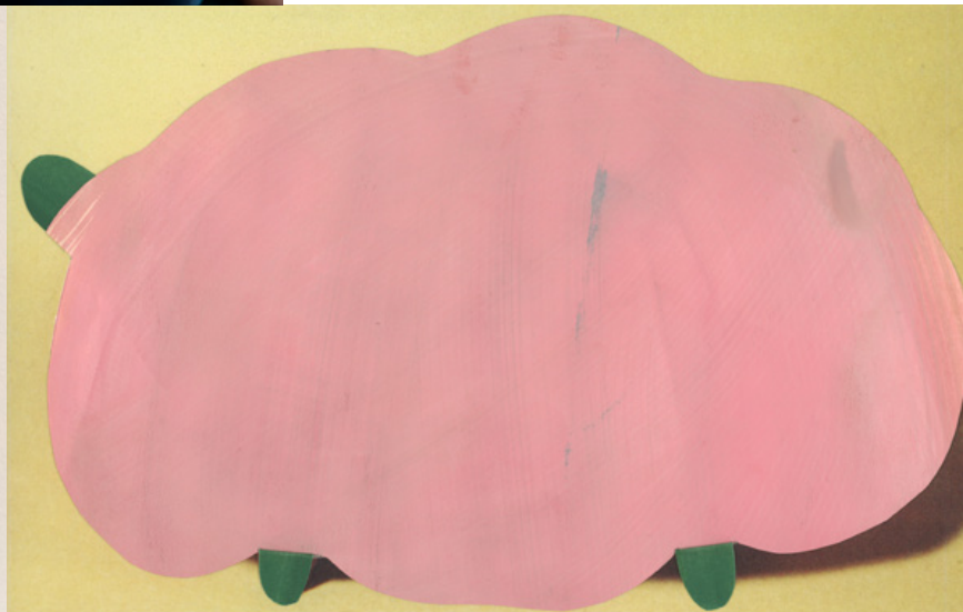
Untitled (figure 66), 2020 Collage with photo and gouache painted paper, wood frame with museumglass