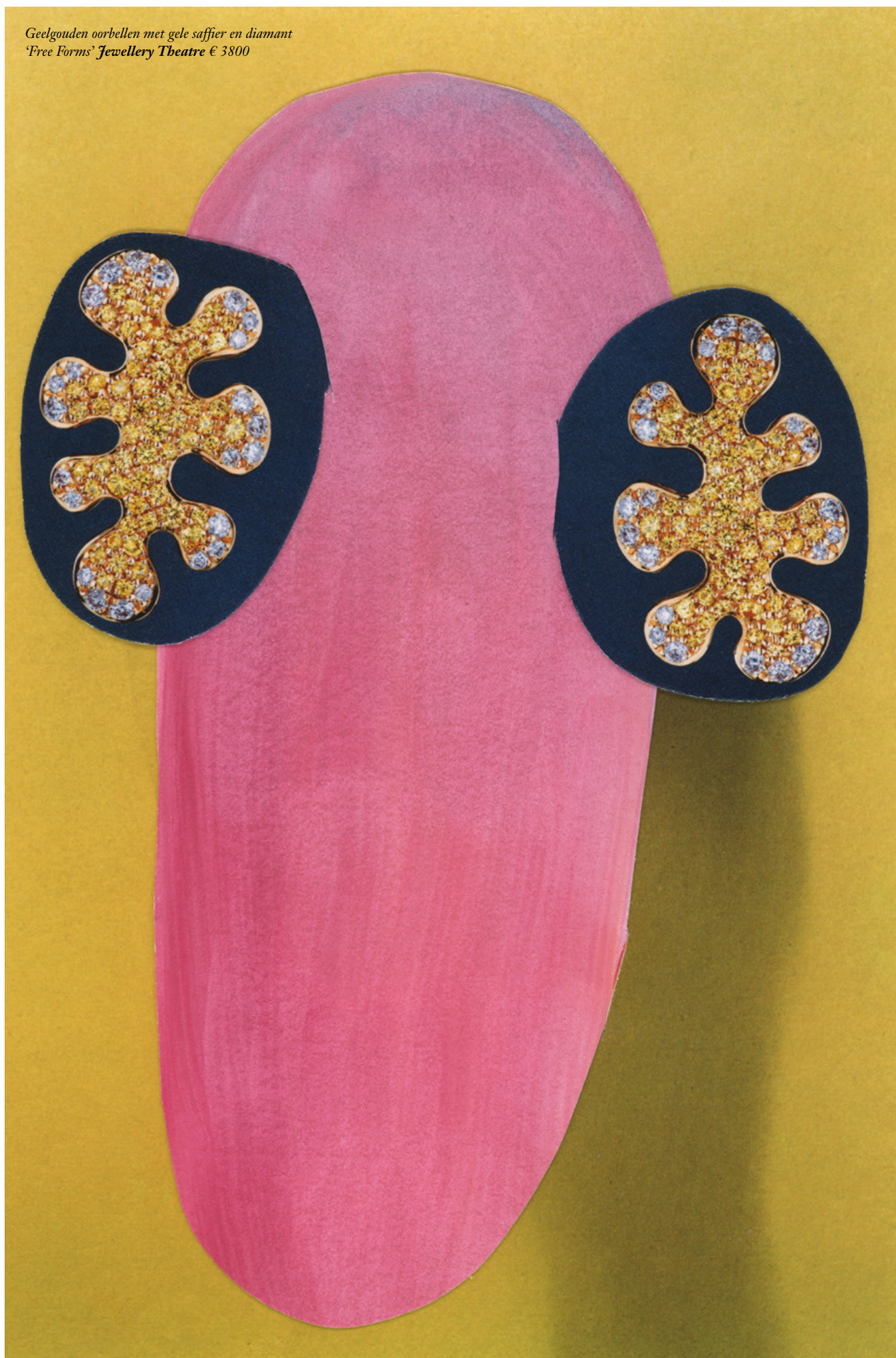
Geelgouden oorbellen met gele saffier en diamant 'Free Forms' Jewellery Theatre € 3800