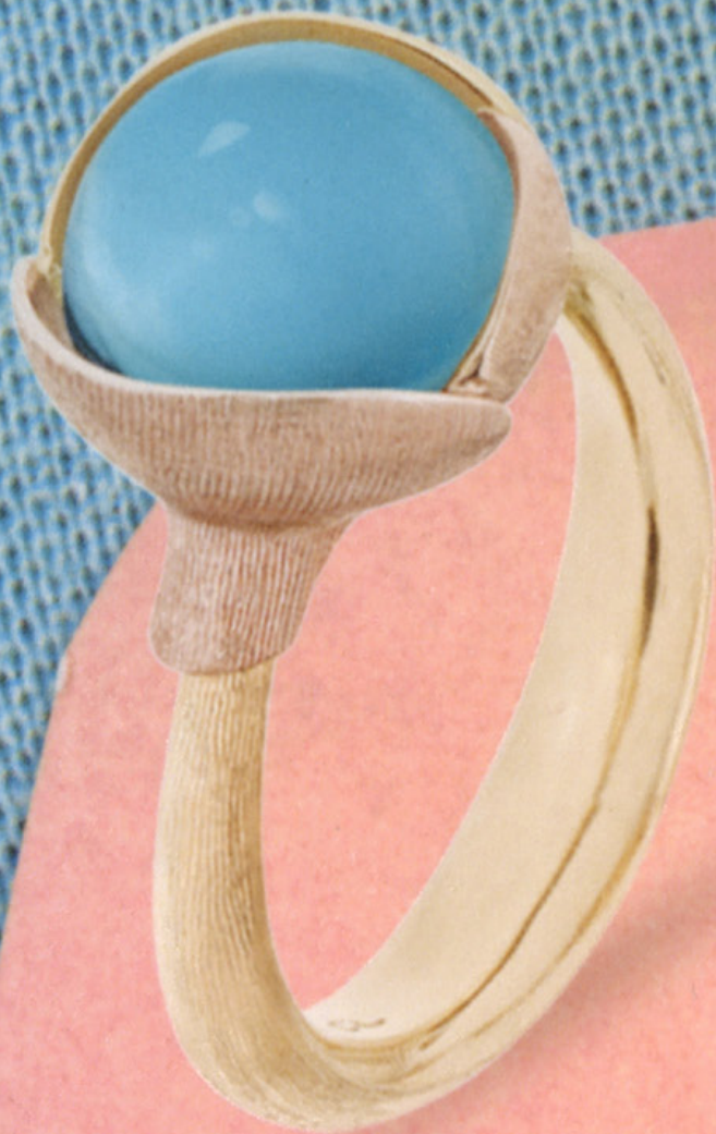
Ring van rosé- en geelgoud met turquoise cabuchon 'Lotus' Ole Lynggaard Copenhagen via Gassan € 3880, roségouden XL clipoorbellen met amazoniet 'Clash de Cartier' Cartier € 13.900