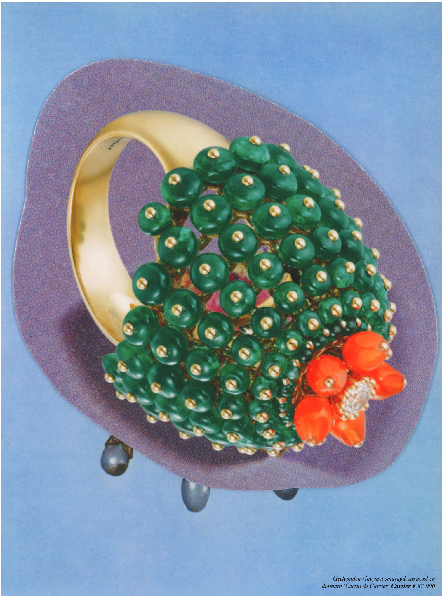
Geelgouden ring met smaragd, carneool en diamant 'Cactus de Cartier' Cartier € 82.000